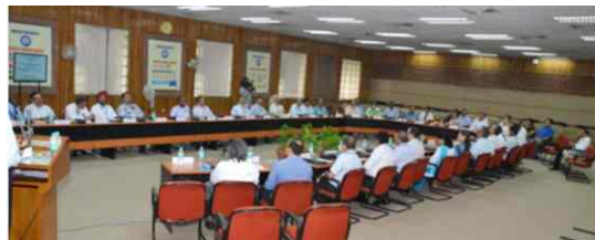
A view of Workshop on Project Management through Alternate Financing