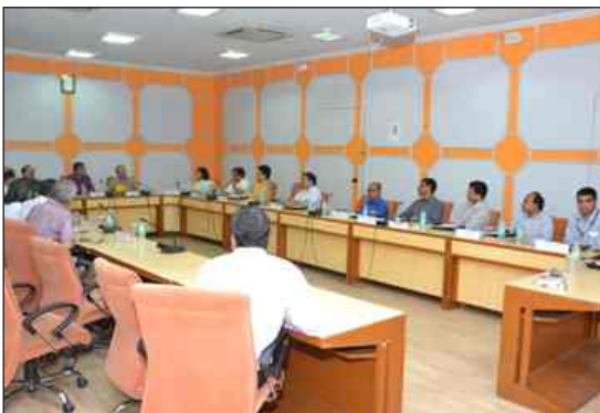
A meeting of All Railway Centralized Training Institutes