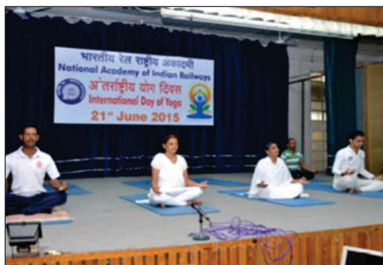
21 जून 2015 को अकादमी में आयोजित योग शिविर का दृश्य