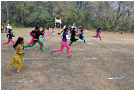
26-01-15 को गणतंत्र दिवस के अवसर पर आयोजित खेलकूद प्रतियोगिता का एक दृश्य