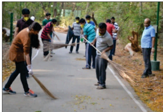
A view of Shramdan done by Probationers of Gp A Induction Programme