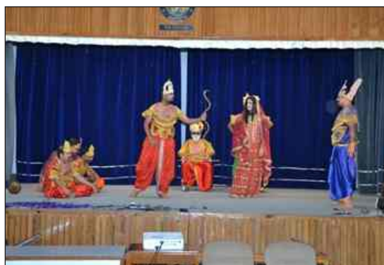
ग्रुप ए इंडक्शन पाठ्यक्रम के प्रतिभागियों द्वारा प्रस्तुत रंगारंग सांस्कृतिक संध्या का एक दृश्य