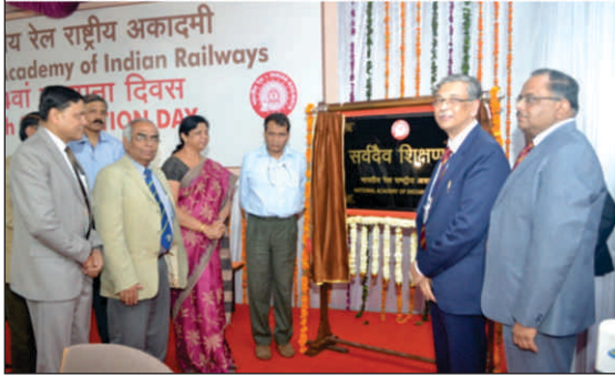
अकादमी के 64वें स्थापना दिवस के अवसर पर 31 जनवरी 2015 को श्री सुरेश प्रभाकर प्रभु, माननीय रेल मंत्री, भारत सरकार द्वारा अकादमी के मोटो 'सर्वदैव शिक्षणम्' का विमोचन किया गया।