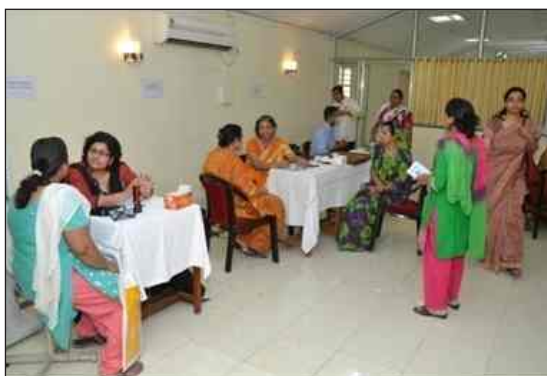
महिला स्वास्थ्य जाँच शिविर का दृश्य