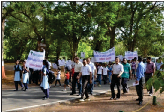
विश्व पर्यावरण दिवस के अवसर पर निकाली गई रैली का एक दृश्य