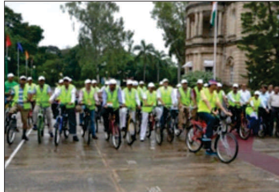
स्वतंत्रता दिवस के अवसर पर आयोजित सायकिल रैली का एक दृश्य