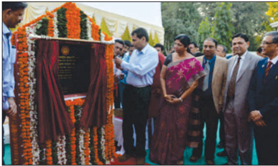
अकादमी में नवीन कक्षा भवन का शिलान्यास करते हुए माननीय रेल मंत्री श्री सुरेश प्रभाकर प्रभु