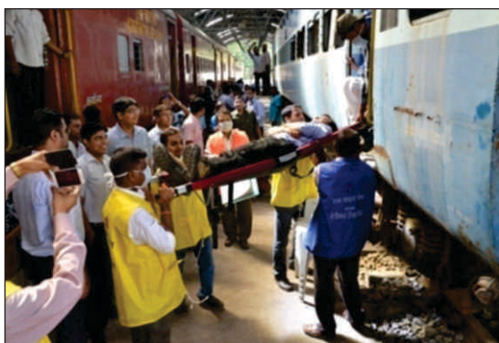
ग्रुप ए इंडक्शन पाठ्यक्रम के प्रतिभागियों के लिए आयोजित दुर्घटना मॉक ड्रिल का दृश्य