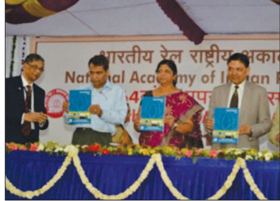
स्थापना दिवस समारोह के दौरान अकादमी की वार्षिक पत्रिका का विमोचन करते हुए श्री सुरेश प्रभाकर प्रभु, माननीय रेलमंत्री, भारत सरकार