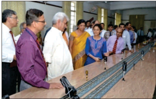
मॉडल रूम विजिट के दौरान एक प्रोबेशनरी अधिकारी माननीय रेल राज्य मंत्री श्री मनोज सिन्हा को सिगनल प्रणाली के बारे में समझाते हुए