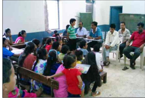
15 अगस्त 2015 को स्वतंत्रता दिवस के अवसर पर कैरम सिंगल तथा वाद-विवाद प्रतियोगिता में बच्चों ने बढ़चढ़ कर भाग लिया ।